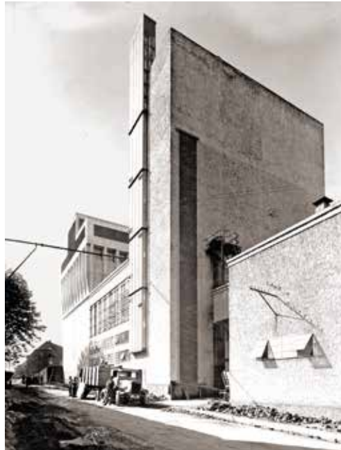
Blick auf die futuristische Bauhausarchitektur der Walsheim-Brauerei, 1929.

Gauleiter Josef Bürckel, der ehemalige Wehrwirtschaftsführer Hermann Röchling sowie der ehemalige Polizeipräsident von Saarbrücken und Metz, Willy Schmelcher, dem es als ehemaligen SS-Gruppen- und Polizeiführer dadurch gelang, von 1954 bis 1962 Mitarbeiter in der Abteilung Zivilverteidigung im Saarländischen Innenministerium zu werden. In diesem politischen Klima war es auch möglich, dass die Beauftragten der Saarbank, die schon im Auftrag dieser Bank die Arisierung und Verwertung der Walsheim-Brauerei AG mitbetrieben und durchgeführt hatten, 1947 sowie 1948 im Namen der Walsheim-Brauerei AG i. L. bei dem Landgericht Saarbrücken Restitutionsansprüche geltend machen konnten. Dagegen haben die Hinterbliebenen von Hans Kanter bis heute nur eine sehr geringe Entschädigung erhalten. Bis heute müssen sie außerdem gegen das entwickelte und weit verbreitete Narrativ ankämpfen, dass das Schicksal ihres Großvaters selbst