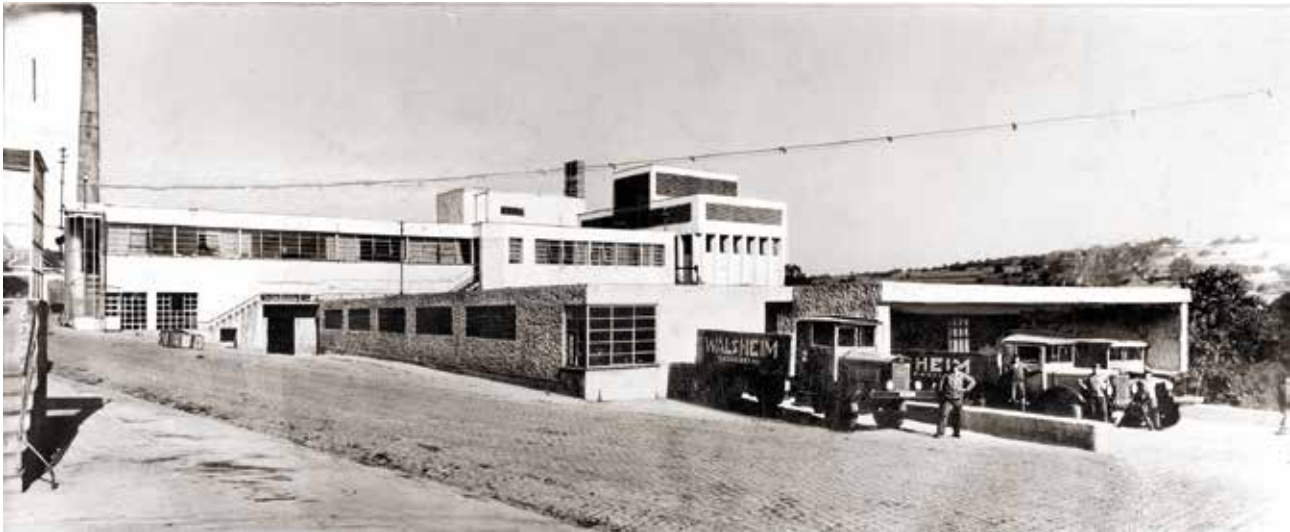
Die ehemalige Walsheim-Brauerei AG im Ortsteil Walsheim, Gemeinde Gersheim, 1929.